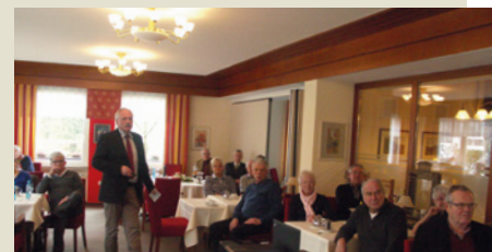
Der Bürgermeister berichtet über „Neues aus Neuenrade“