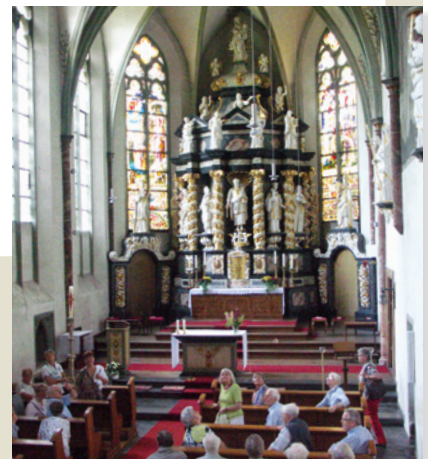
Innenraum der Klosterkirche mit Hochaltar